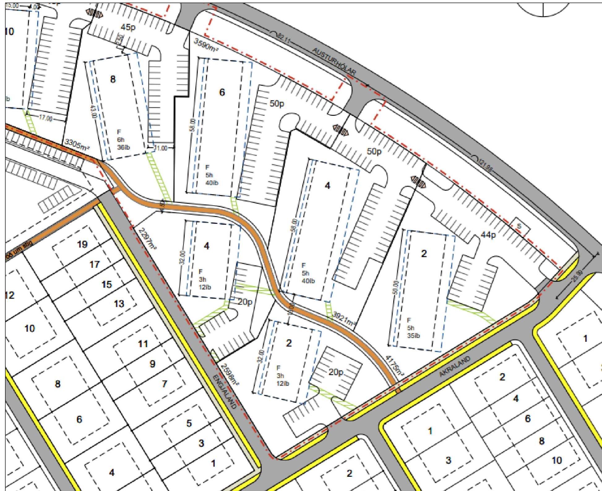
Deiliskipulag fyrir breytingu Mkv. 1:1000