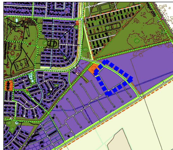
ADALSKIPULAG ÁRBORGAR 2010-2030 Yfirlitsmynd ekki í kvarða

Deiliskipulag þetta sem auglýst hefur verið skv. 1.mgr.41.gr